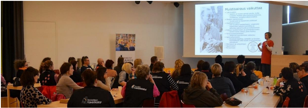
Kuva, koiraohjaajien koulutuspäivä

Valtakunnallinen Kaverikoira- ja lukukoiraseminaari pidettiin Oulussa 2.-3.11.2019